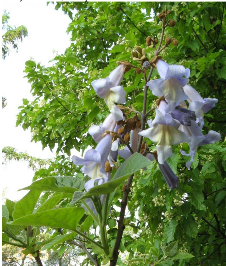
Listy – vstřícné